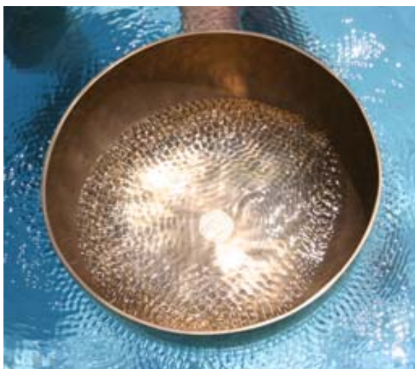
Die Schwingung der klingenden Klangschale breitet sich gleichmäßig im Wasser aus.

Um die physikalische Wirkung der Klänge zu verstehen ist es hilfreich, sich zu verdeutlichen, dass Klang Schwingung ist, die in Form einer Schallwelle übertragen wird. Schall breitet sich besonders gut im flüssigen Medium aus.