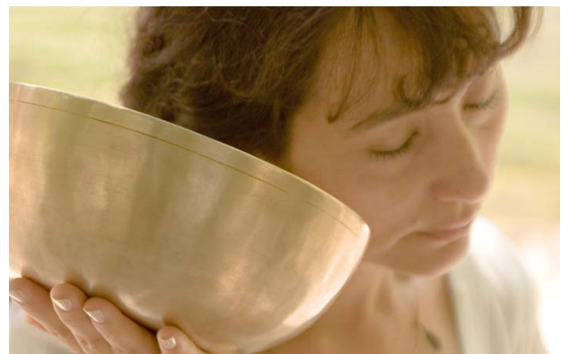
Den Klängen lauschen und sich von ihnen in die Stille führen lassen.