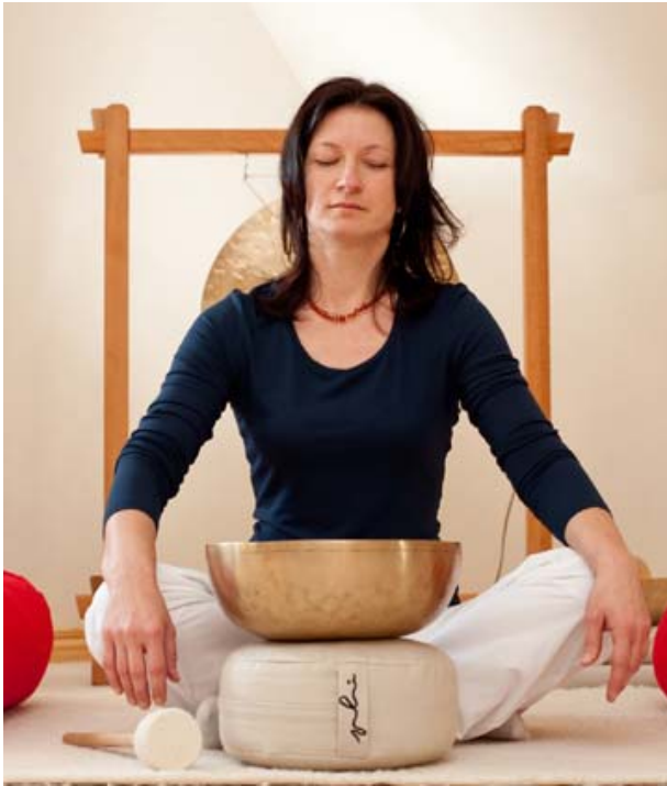
Zu den Klängen der Klangschale entspannen – ganz bei sich ankommen – Ruhe finden.