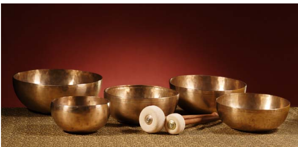
Klangschalen für die Klangmassage

Bei der Klangmassage kommen spezielle Klangschalen, die „Peter Hess® Therapieklingschalen“ zum Einsatz. Sie wurden in Jahrzehnte langer Forschungs- und Entwicklungsarbeit für diese Arbeit konzipiert und optimiert. Mit ihrer außergewöhnlich hohen Klang- und Schwingungsqualität sprechen die verschiedenen Schalentypen, mit ihren jeweils spezifischen Frequenzspektrum, bestimmte Körperbereiche besonders gut an: Die Beckenschale den Beckenbereich, die Herzschale den Brustbereich, die Gelenk- bzw. Universalchale die Extremitäten und Gelenke, aber auch den gesamten Körper. Darüber hinaus gibt es noch eine Kopfschale sowie eine XL-Schale, die so groß ist, dass sich ein erwachsener Mensch hineinstellen kann.